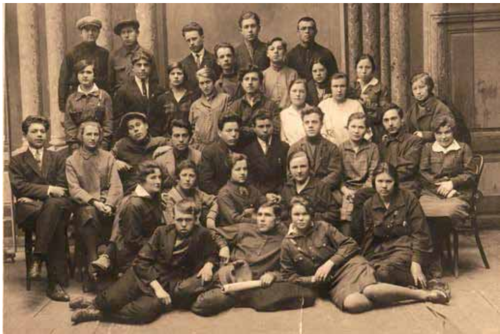
Коллектив театра, 1920-е гг.