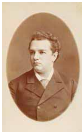
Артист М.И. Писарев