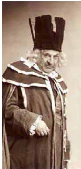
Артист М.М. Тарханов