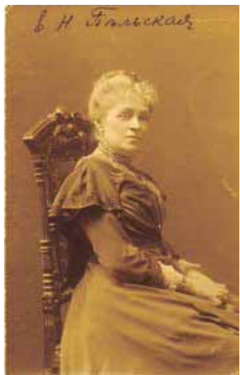
Актриса Е.Н. Бельская