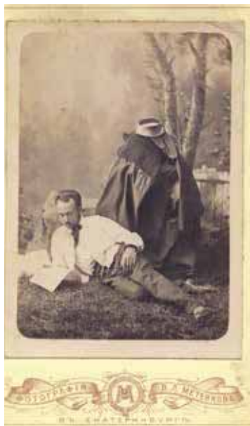
Актёр А.М. Звездич