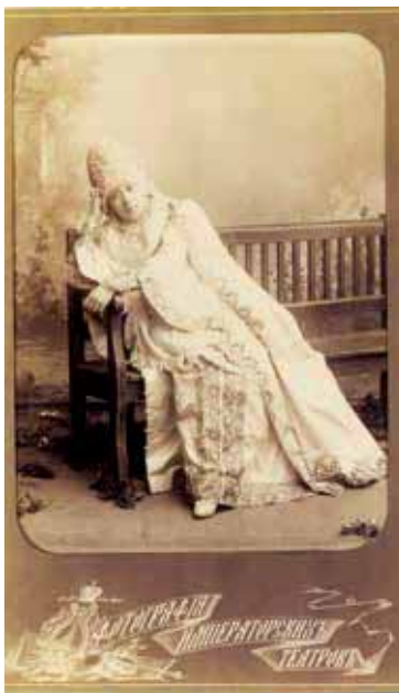
Актриса В.Ф. Комиссаржевская